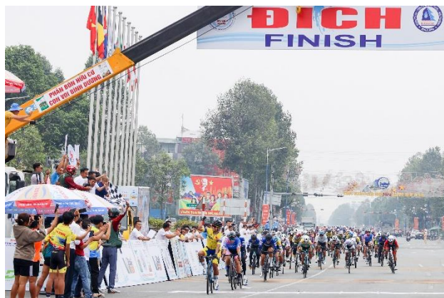
Đoàn đua về đích chặng 1 vòng quanh tỉnh Bình Dương