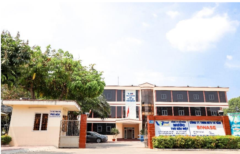
Trụ sở Công ty Cổ phần Nước Thủ Dầu Một (TDM)

• Công ty Cổ phần Nước Thủ Dầu Một (TDM) lợi nhuận tăng so với năm 2022. Dù chịu ảnh hưởng chung của tình hình kinh tế trong nước và thế giới. Năm 2023 sản lượng nước tiêu thụ giảm 1,36%, trong khi giá nước sạch không thay đổi, dẫn đến doanh thu giảm 5,7% so với năm trước (2022). Nhờ định hướng sáng suốt của HĐQT, sự điều hành hiệu quả của Ban Tổng giám đốc, Công ty cổ phần Nước Thủ Dầu Một (TDM) đã ghi nhận thêm khoản doanh thu 54,9 tỷ đồng từ hoạt động mua bán vật tư thiết bị và 118,5 tỷ đồng từ hoạt động tài chính, cổ tức. Kết quả lợi nhuận trước thuế năm 2023 của TDM tăng 71,21 tỷ đồng so với năm 2022.