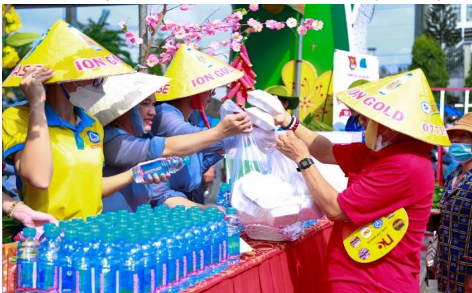
Khách thập phương dự Lễ hội Rằm tháng Giêng Bình Dương nhận nước uống, thức ăn tại quầy BIWASE – ION GOLD

• BIWASE ION GOLD đồng hành cùng “Lễ hội 0 đồng”. Lễ rước kiệu Bà Thiên Hậu Bình Dương, còn có tên gọi khác là Lễ hội Rằm Tháng Giêng, lễ hội dân gian kéo dài và lớn nhất tỉnh Bình Dương được