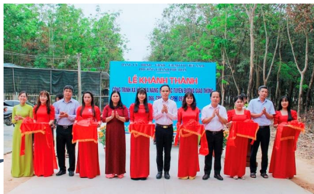
Lễ khánh thành 3 tuyến đường GTNT tại Tx Bến Cát do BIWASE tài trợ