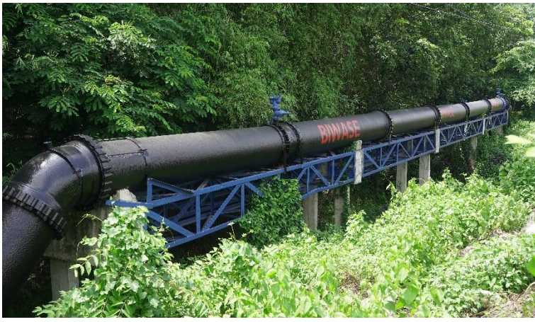
Chi nhánh Cấp nước Chơn Thành đầu tư mạnh vào phát triển đường ống, chống thất thoát và khách hàng, từ đó sinh lãi trước kế hoạch

45.000m 3 /ngày đêm, vượt 50% công suất thiết kế. Thời gian tới Chi nhánh cấp nước BIWASE Chơn Thành tiếp tục đầu tư nâng công suất, nhà máy kết hợp mở rộng địa bàn phục vụ về hướng cầu Nha Bích, xã Minh Thắng, Minh Lập và TX Bình Long.