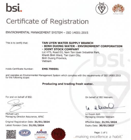
Chứng nhận quốc tế Hệ thống quản lý môi trường ISO 14001: 2015 do BSI (Hoàng gia Anh) cấp cho Chi nhánh cấp nước Tân Uyên

• Chi nhánh cấp nước Tân Uyên đạt chứng chỉ ISO 14001 và ISO 45001. Sau quá trình kiểm định đạt yêu cầu, BSI Việt Nam (Viện Tiêu Chuẩn Vương Quốc Anh tại Việt Nam) tiến hành cấp Chứng nhận Hệ thống quản lý môi trường ISO 14001: 2015 và Chứng nhận Hệ thống quản lý an toàn và sức khỏe nghề nghiệp ISO 45001:2018 cho Chi nhánh cấp nước Tân Uyên thuộc Công ty CP - Tổng công ty Nước - Môi trường Bình Dương. Chứng nhận có hiệu lực từ 31/1/2024 đến 31/1/2027. BSI có giá trị và thông dụng toàn cầu về tiêu chuẩn quản lý với các giải pháp cần thiết để biến các chuẩn mực thành thói quen của sự hoàn hảo.